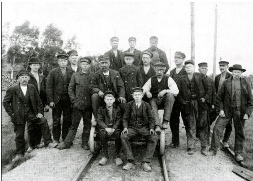
Arbetare på Bolmabanen

Då jag gick i skolan byggdes Halmstad-Bolmen-banan. Då bodde 4 rallare i kammaren, i regel hyggliga och präktiga grabbar.