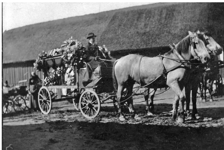
Petronellas likfärd 1920

Sedan blev det begravning och bouppteckning och arvskitte. Det blev inte så mycket till var och en. Mor hade ju bara 1000 kronor. Köpte gravsten och gravplats. Gravstenen kostade 550 kr, gravplatsen 25 kr. Mors kläder var det inte mycket med. Töserna delade dem.